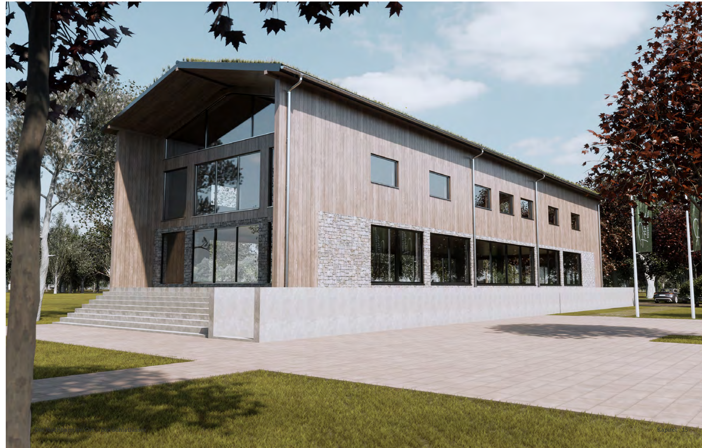
Die Nachbarn im Ort - Die Schaffässer